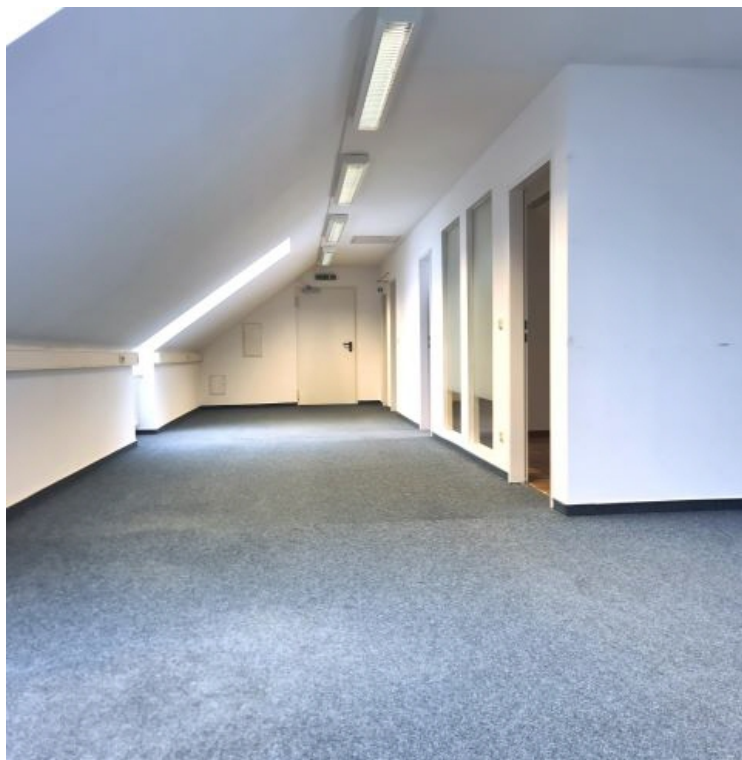
Mietinheit 5H2 5.OG