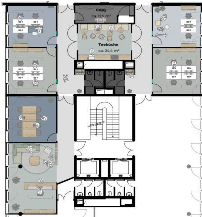
3. OG Bestand